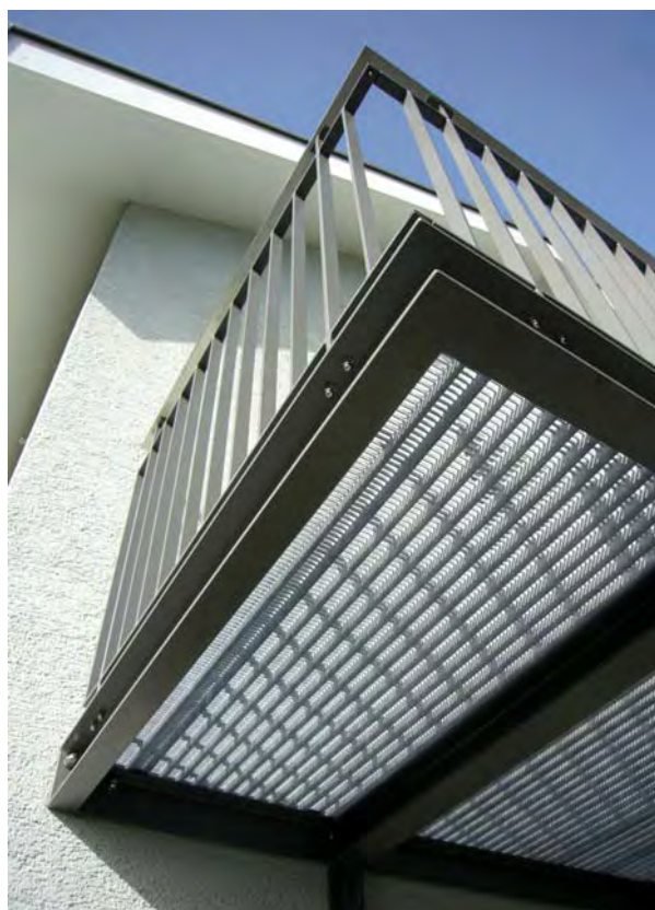
Detailansicht neuer angehängter Balkon