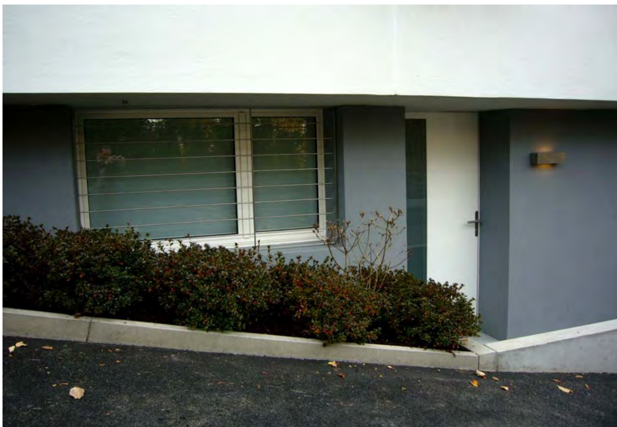
neues Zimmerfenster im ehemaligen Tankraum mit Eingang in ehemaligen Heizraum