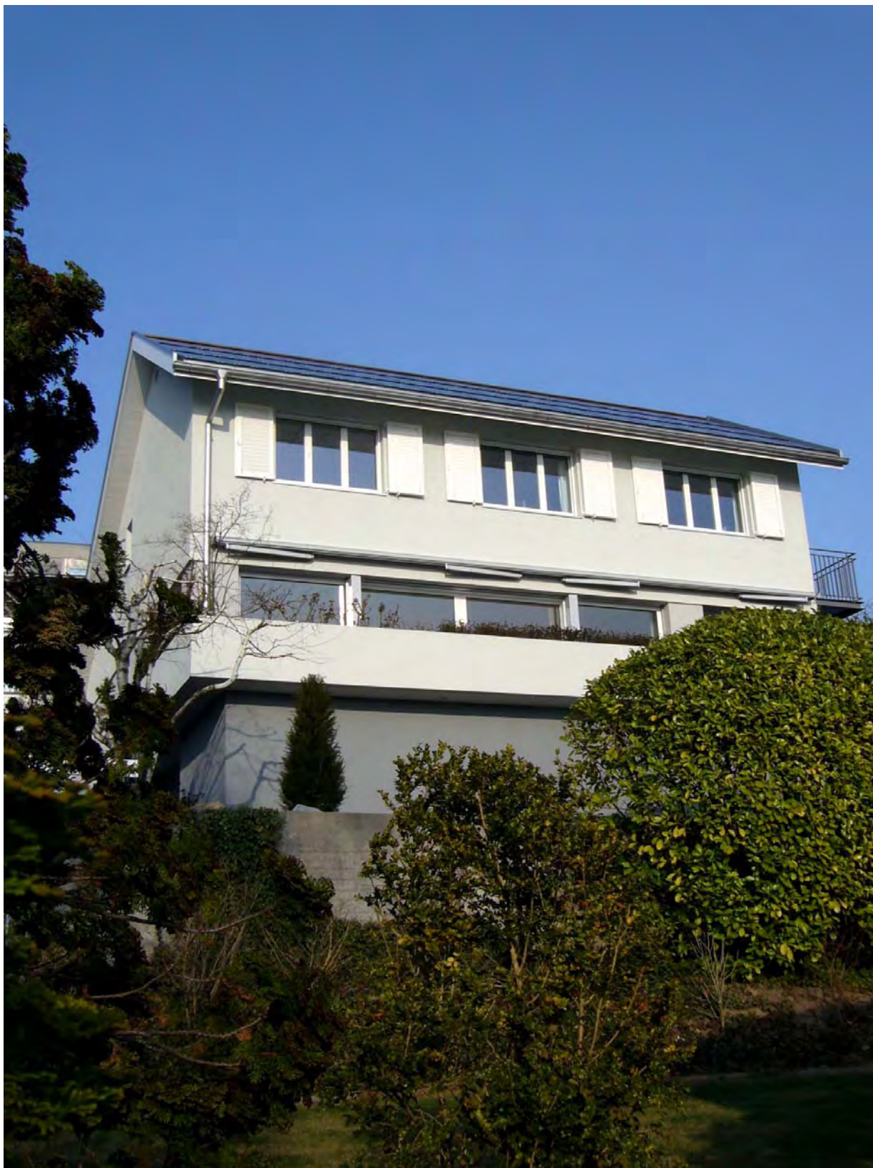
Südwestfassade mit Photovoltaik