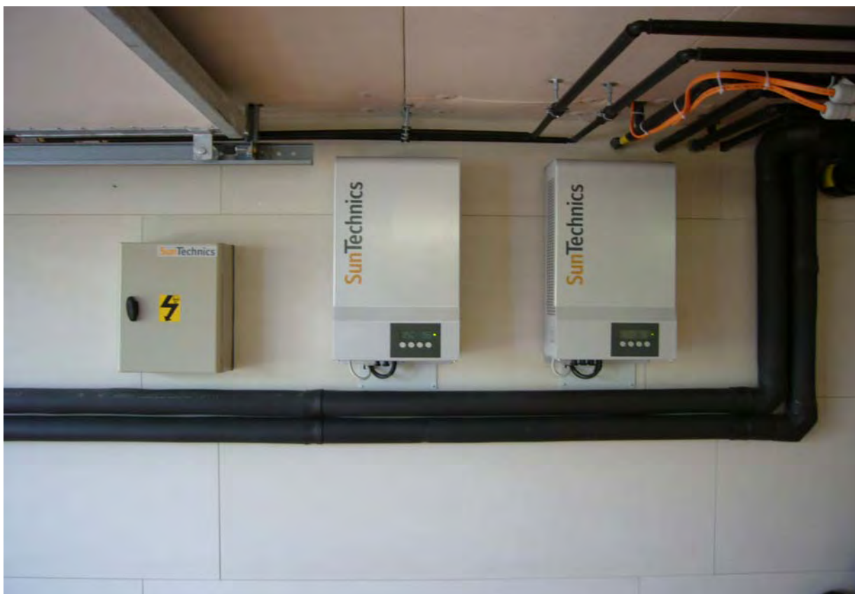
Solartechnik auf/in Spezialisolerpaneele montiert