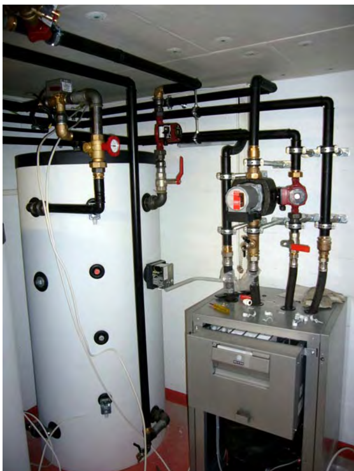
EWP in ehemaligen Luftschutzraum