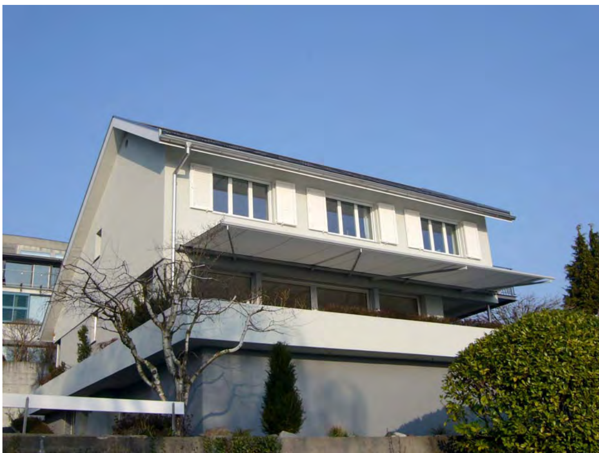
Südwestfassade mit Photovoltaik und Sonnenschutz