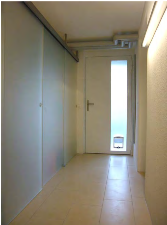
Dusche / WC hinter Schiebefront