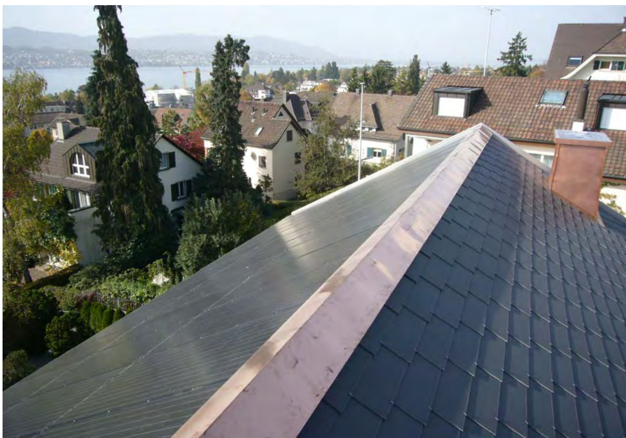
Firstblech in Kupfer als Trennung zwischen Solarpaneelen und Eternitdeckung