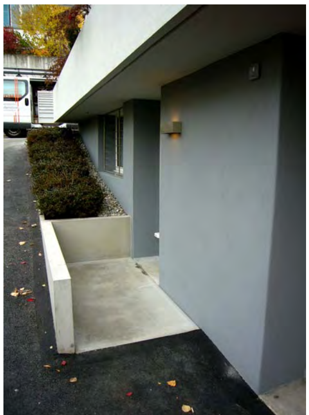
neuer Eingang in ehemaligen Heizraum