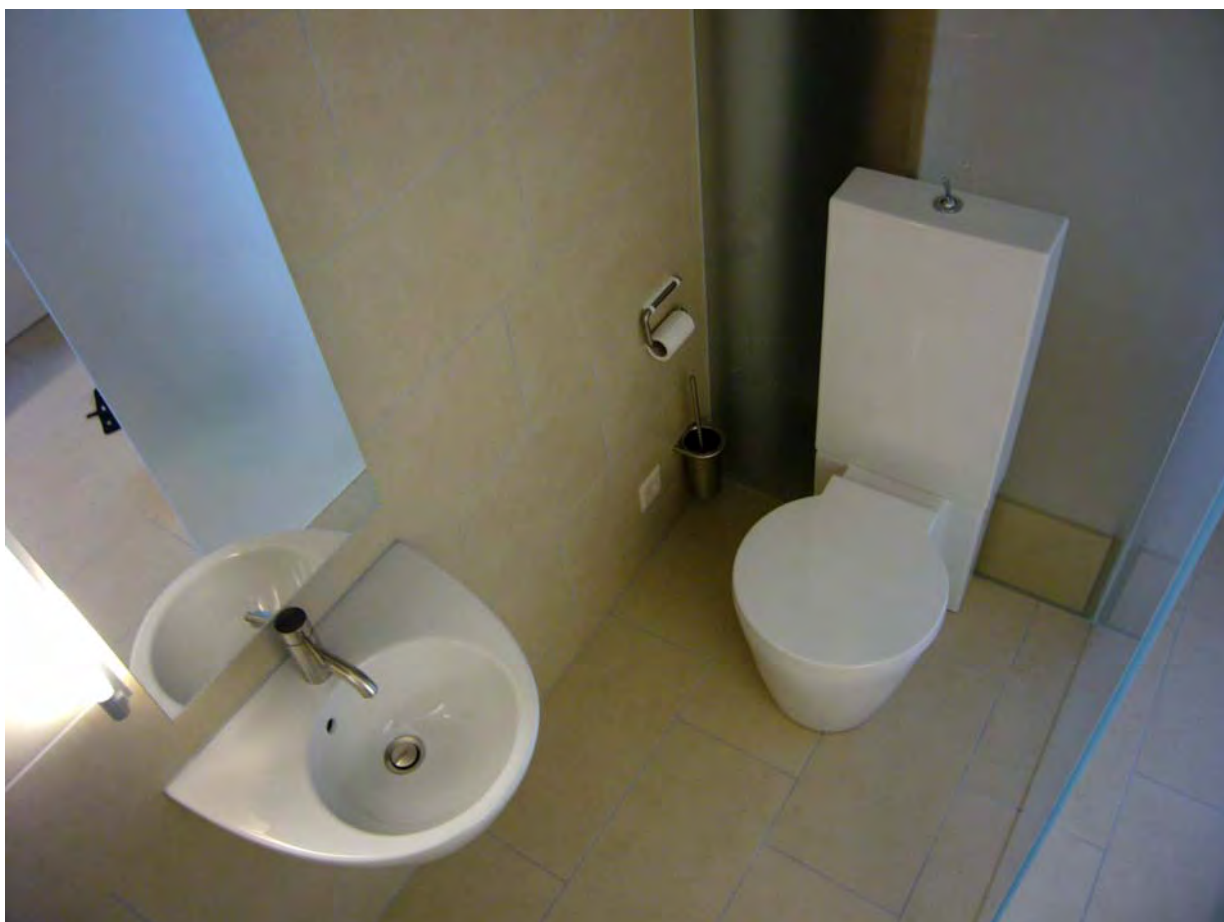
WC / Dusche hinter Glasschiebetüren in ehemaligem Heizung