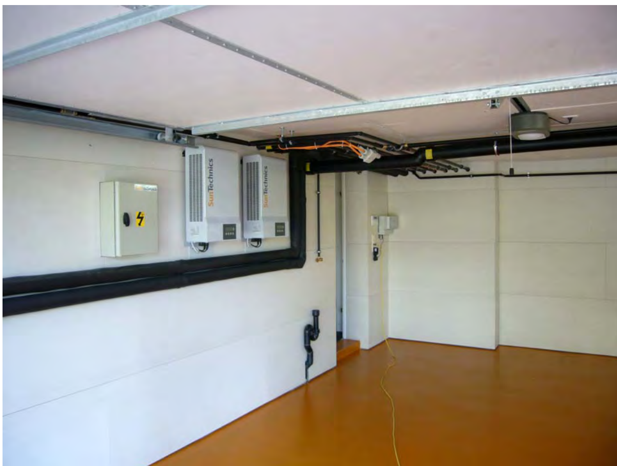
Feldverteiler und Wechselrichter in Garage Zuleitungen über ehemaligen Kaminzug