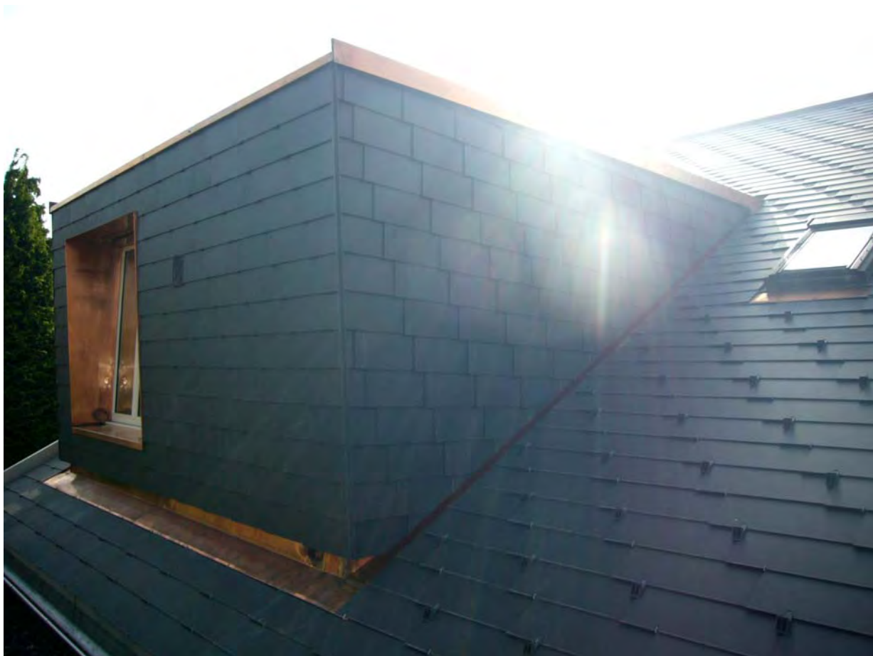
neu verkleideter Dachaufbau