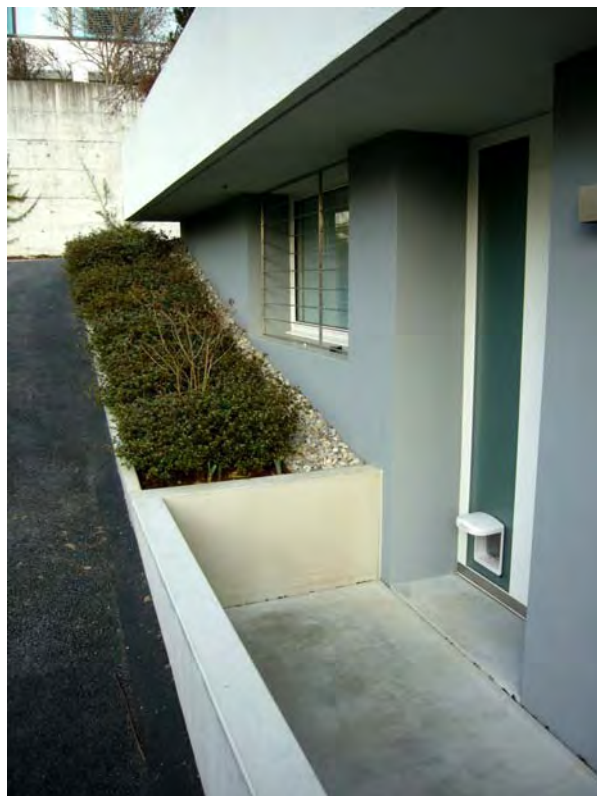
neuer Eingang in ehemaligen Heizraum