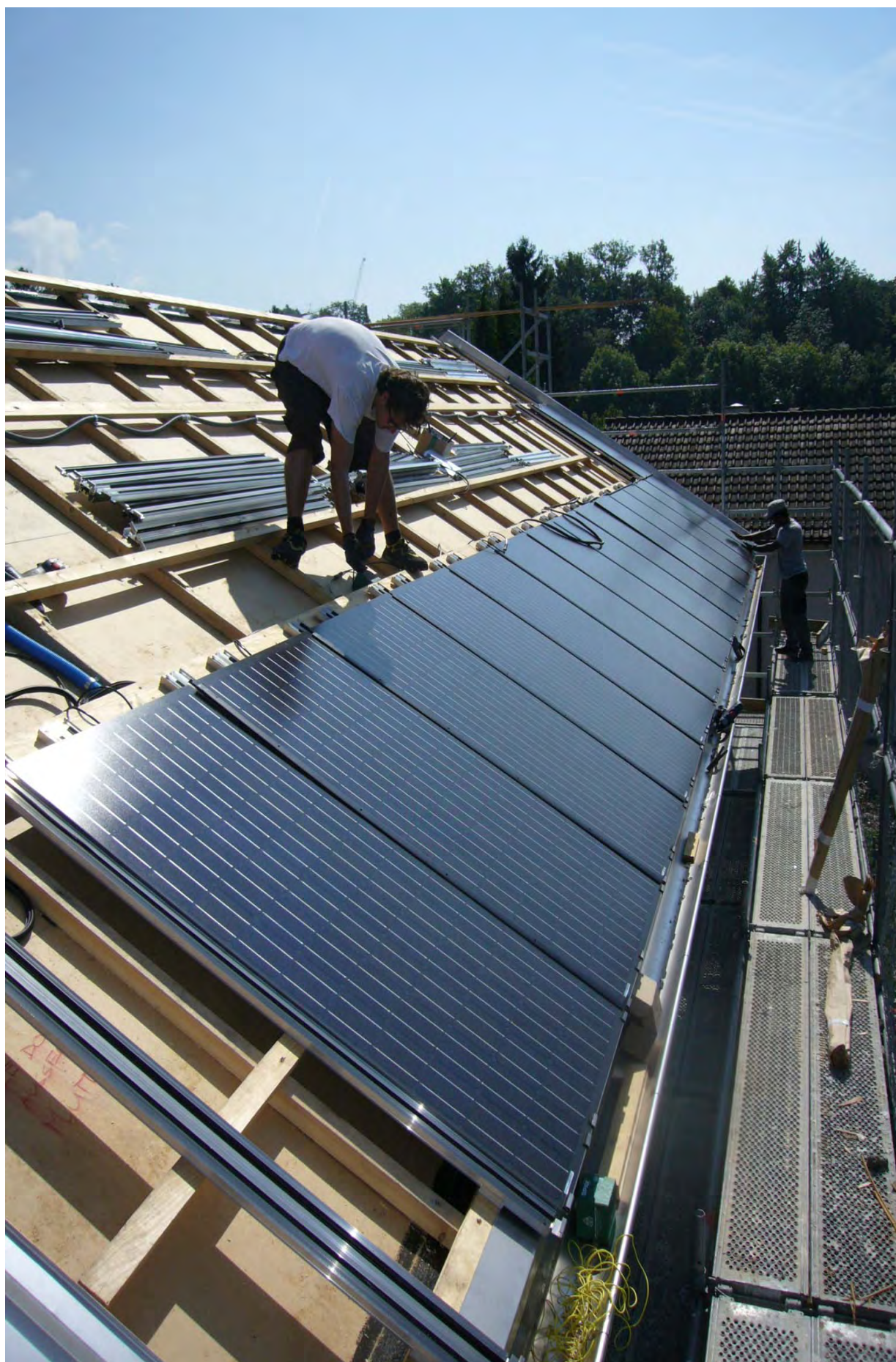
Montagearbeiten der Solarpaneele