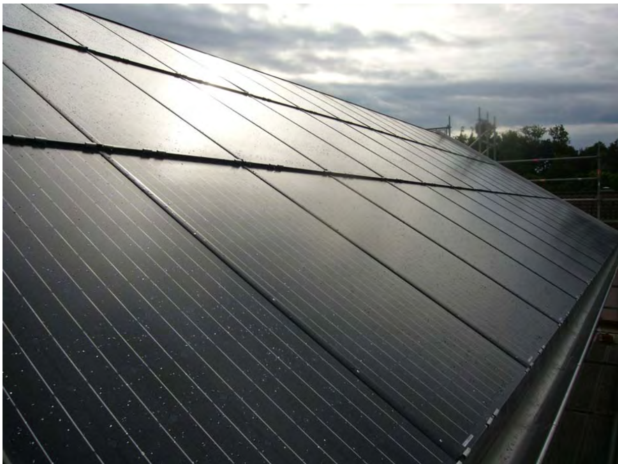
Dachseite Südwest ganzflächig mit Photovoltaikpaneelen vollintegriert belegt